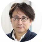
西村 訓弘（教授・特命副学長、内閣府戦略的イノベーション創造プログラムプログラムディレクター等を兼任）